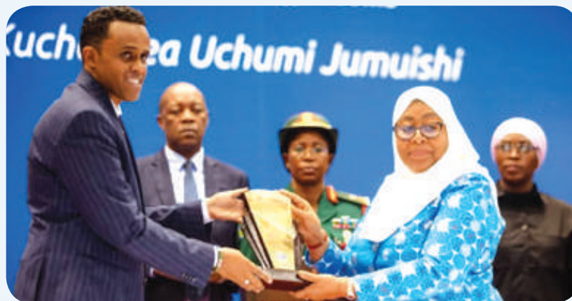
Mhe. Rais Dkt. Samia Suluhu Hassan akipokea Tuzo kwa kutambua mchango wake muhimu katika Maendeleo ya Ushirika nchini. Tuzo hiyo ilikabidhiwa na Waziri wa Kilimo, Mhe. Hussein Bashe kwenye uzinduzi wa Benki ya Ushirika

2.7.1. Kuanzisha Mfumo wa Kidijitali wa Usimamizi wa Vyama