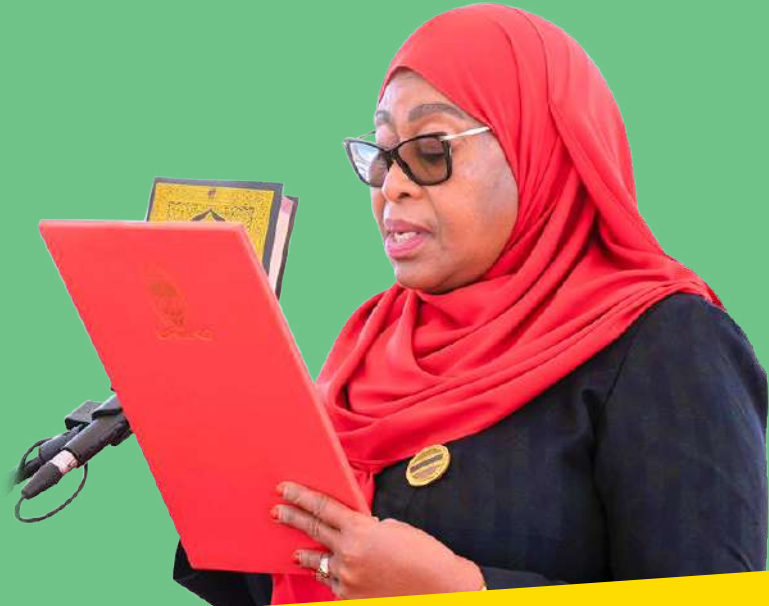
Mhe. Dkt. Samia Suluhu Hassan Rais wa Jamhuri ya Muungano wa Tanzania

Mwenyekiti wa Kamisheni, Menejimenti na Watumishi wa Tume ya Maendeleo ya Ushirika tunakupongeza kwa kuchaguliwa kuwa Rais wa Jamhuri ya Muungano wa Tanzania. "Kazi na Utu, Tunasonga Mbele"